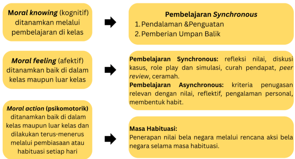
Gambar 1.2. Tiga Komponen Pembelajaran Karakter dalam Pelatihan dasar CPNS (diolah oleh Penulis)

Pembelajaran dalam agenda I ini diharapkan menjadi sarana transformasi pengetahuan dalam aspek pengetahuan (aspek kognitif), sebagai sarana transformasi nilai untuk membentuk sikap (aspek afektif), yang berperan dalam mengendalikan perilaku (aspek psikomotorik) sehingga tercipta profesional PNS sebagai pelayan masyarakat yang tidak hanya memegang teguh nilai dan keyakinan, tetapi juga mampu mengimplementasikannya dalam bentuk sikap dan perilaku yang mengekal menjadi mindset .